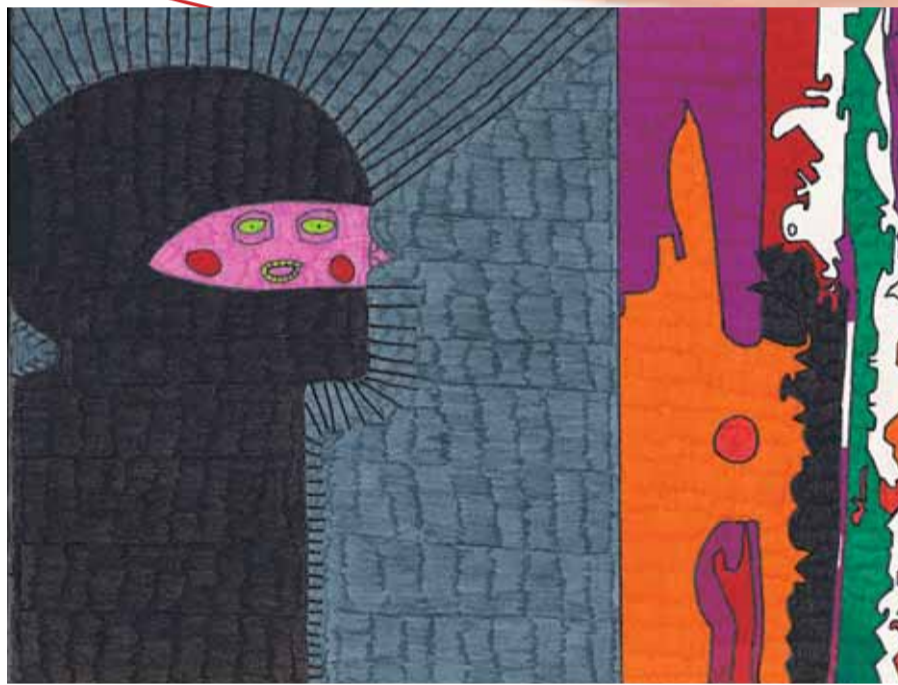
Georges Gauchy • Marqueurs 30 x 40 cm • 2000